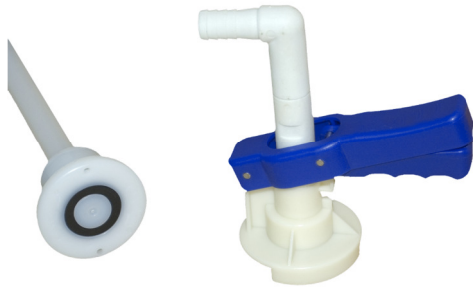
1.8 CDS koppeling, IBC zuigbuis