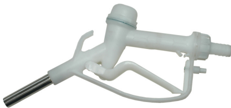
2.0 Manuele pistoolkra