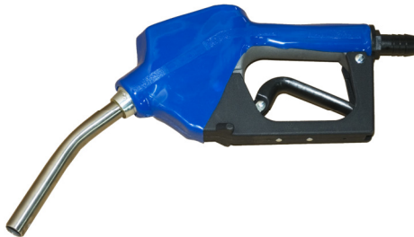
1.9 Automatische pistoolkraan met r.v.s. tuit